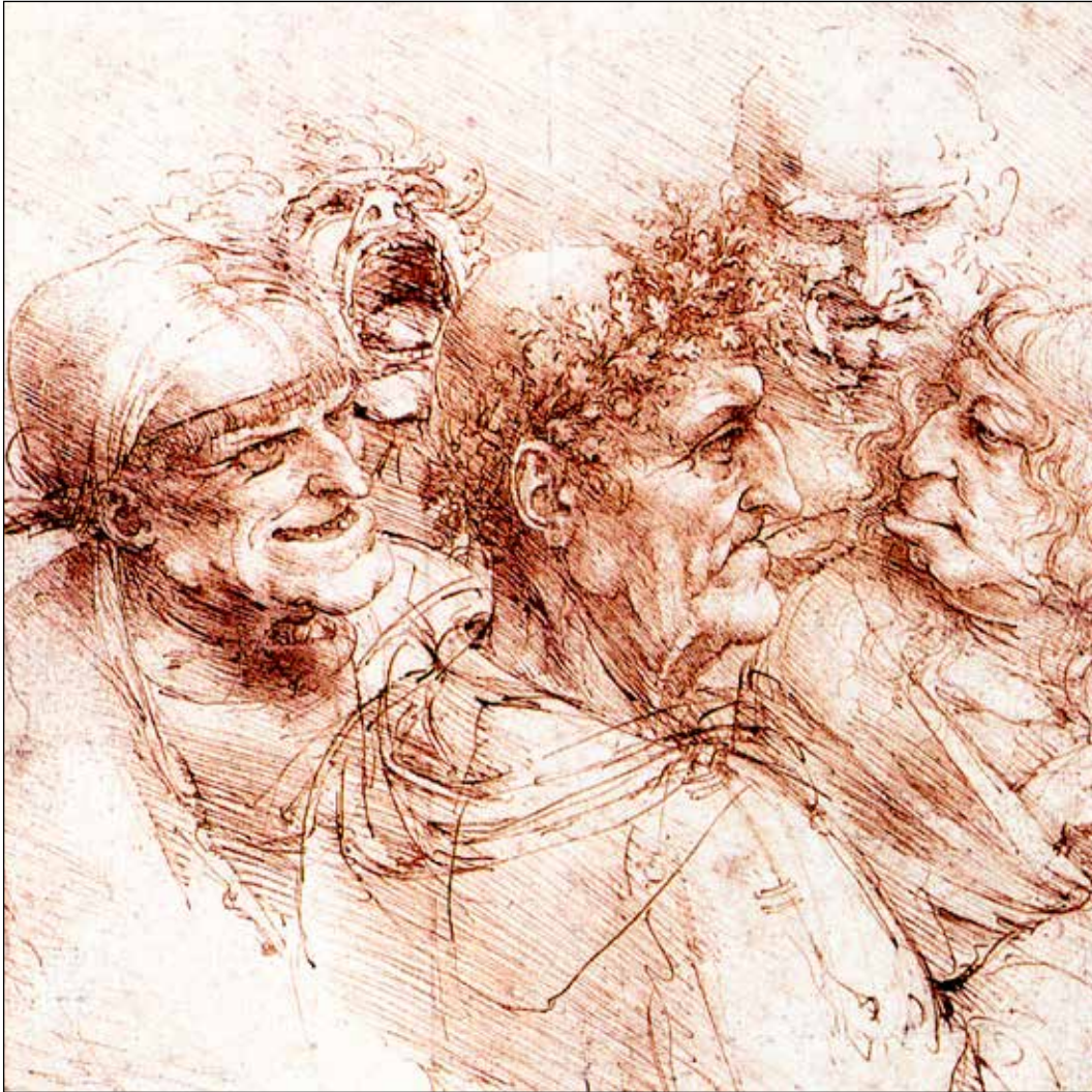
Vijf groteske koppen ca. 1494, pen en inkt

van ons leven niet meer van haar of hem willen wijken. Zelden lukt het ons door het woord heen te breken en iets of iemand werkelijk te zien als volkomen uniek en mysterieus ofwel als iets wat woordeloos is.