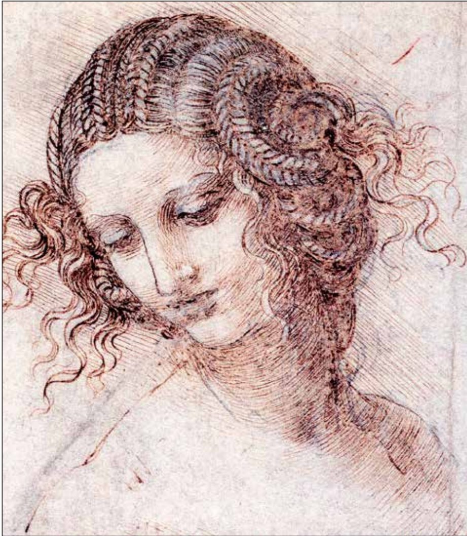
Hoofd van Leda, ca. 1505-1510, pen en inkt over zwartkrijt

werkelijke denken opgang. Toch zal met al het denkwerk de zwaartekracht enkel verpakt worden in nog veel meer woorden zonder dat het ooit duidelijk wordt wat nu werkelijk zwaartekracht is.