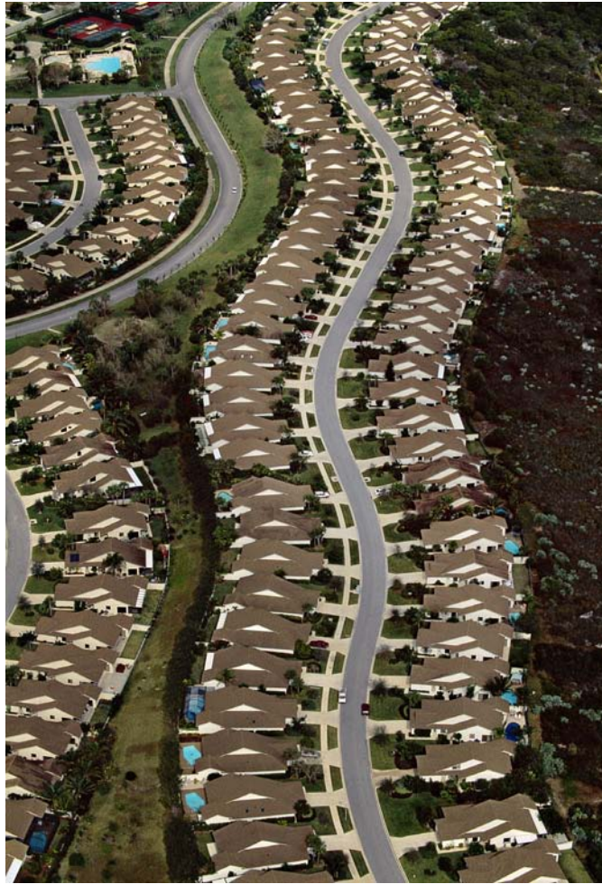
Palm Beach Florida: Herhaling van gelijkvormige elementen

De mens heeft een omgeving nodig die een hiërarchische opbouw heeft