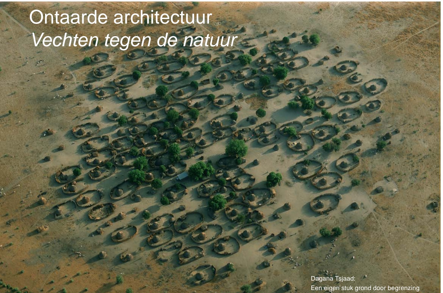
Dagana Tsjaad: Een eigen stuk grond door begrenzing

De hele geschiedenis van de mensheid is een poging om los te komen van de natuur. Voor de eerste mens was de onaangetaste natuur meedogenloos en daardoor enorm angstaanjagend; hij was hulpeloos overgeleverd aan de grillen van de natuur, aan zijn natuurlijke omgeving. Eeuwenlang heeft hij tegen de wilde natuur gevochten, het resultaat is zichtbaar in alle uithoeken van de wereld.