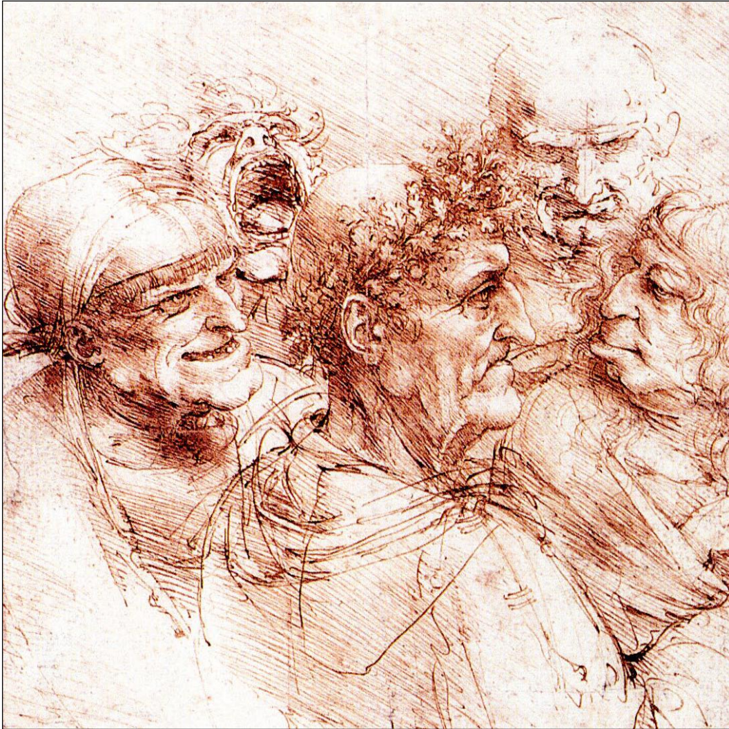
Vijf groteske koppen ca. 1494, pen en inkt

van ons leven niet meer van haar of hem willen wijken. Zelden lukt het ons door het woord heen te breken en iets of iemand werkelijk te zien als volkomen uniek en mysterieus ofwel als iets wat woordeloos is.