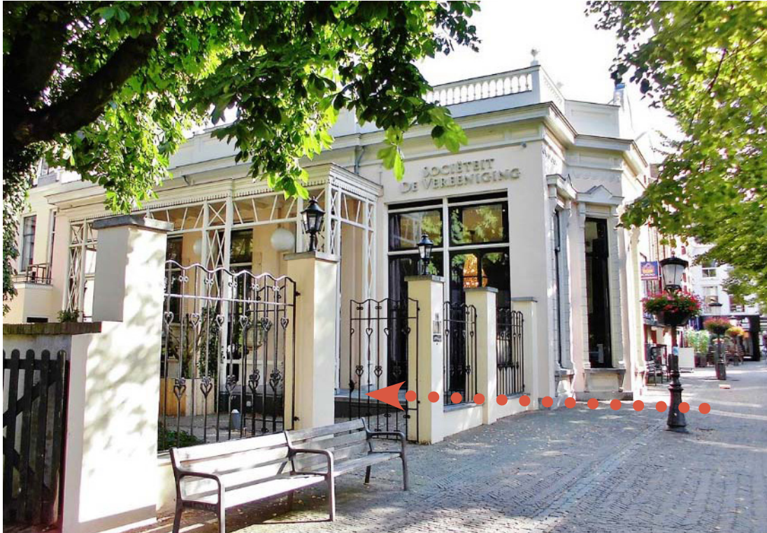
Door de poort bij Grand Bar & Brasserie Marie naar binnen

Het pand is gekocht in 1872 door sociëteit de Vereeniging en is sindsdien een mannenbolwerk. Het voorste deel is verhuurd aan Grand Bar & Brasserie Marie waar de leden elke maandagavond bij elkaar komen. In het achterste deel ligt de Koning Willem III zaal aan een binnentuin die eigenlijk de huiskamer is van de leden, behalve op de boekpresentatie . Dus men moet door het hekwerk via de binnenplaats en doorlopen naar de achterste zaal, zie ook de foto's hieronder.