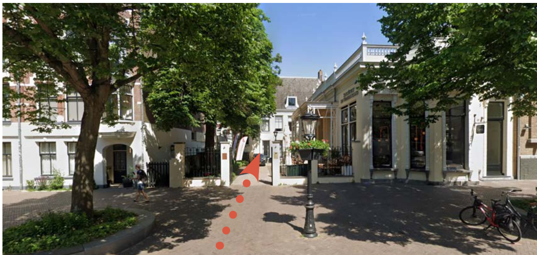
Door de poort over de binnenplaats naar de achterste zaal Koning Willem III